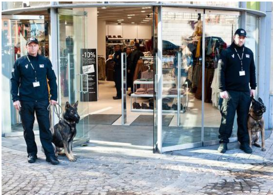
Surveillance et gardiennage sont leurs principales missions.