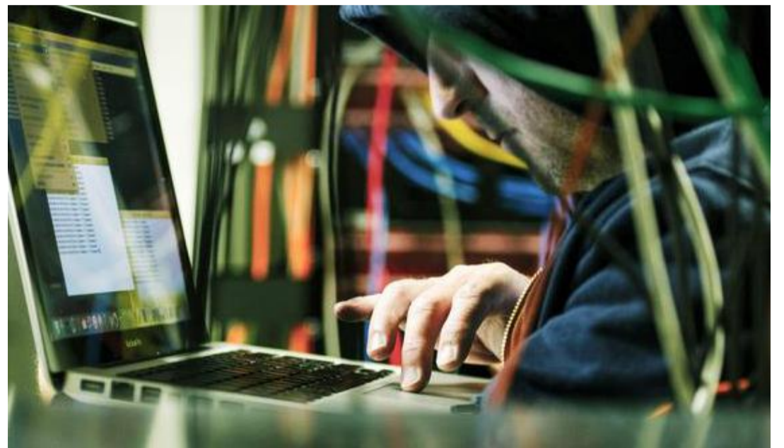
Protection Unit est allé chercher des anciens experts d'Interpol.